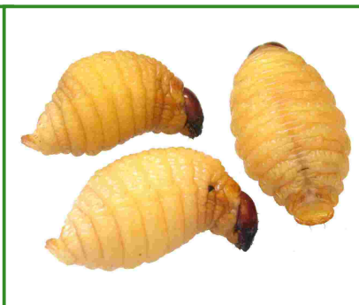
Larves de Rhynchophorus ferrugineus