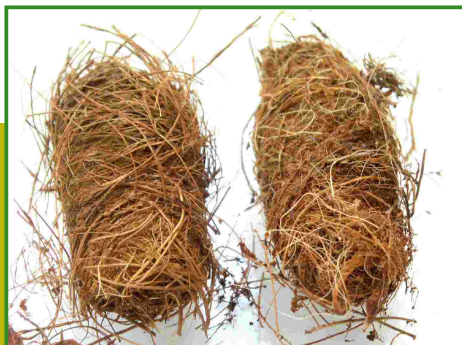
Capolls de Rhynchophorus ferrugineus