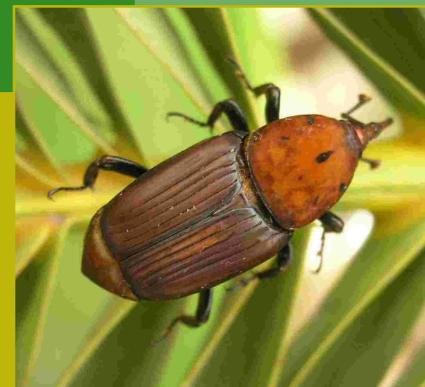
[ Rhynchophorus ferrugineus ]