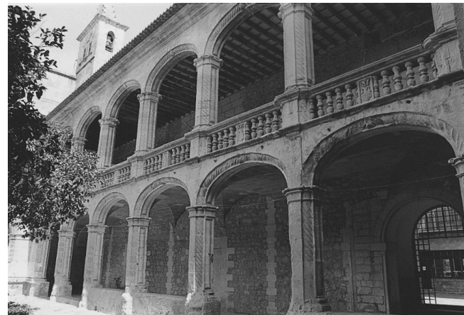
Galeria Sud del claustre

cia el paper fonamental que van assumir les fundacions conventuals en la consolidació dels nous estils, a través de les quals es va impulsar un art de gran riquesa plàstica i carregat de significació religiosa, que va propiciar la consolidació i l'arrelament de la nova plàstica.