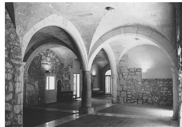
Antiga cuina de la casa conventual. Actualment dependències dels jutjats

El resultat va ser la configuració d'un claustre que respon al gust barroc per la seva concepció monumental i pel tractament plàstic i expressiu dels elements configuradors. Segueix un traçat regular, envoltat per doble galeria porticada, coberta per volta claustral en el pis inferior i per embigat en el pis superior. La planta és rectangular, amb sis arcades a les galeries nord i sud, i cinc a les galeries est i oest. L'espai central és ocupat per l'aljub, amb coll octogonal sobre el qual es recolza una estructura de ferro forjat, que és rematada per la creu dominica. Les arcades són definides per arcs carpanells que se sustenten damunt pilars octogonals, els quals s'aixequen damunt sòcols que es troben units a la planta baixa, mentre que a la superior la socolada dels intercolumnis és substituïda per balustrades. Els pilars reprenen el model dels suports de la capella del Roser i del Cor, de tal manera que presenten quatre cares lliures de decoració, i altres quatre amb estries helicoidals que es perllonguen per l'extradós dels arcs, en els quals destaca un floró divuitesc a l'alçada de la clau; estries i florons són ornaments de diferent procedència estilística -l'estria helicoidal va ser ja emprada a l'arquitectura monàstica medieval; per exemple,