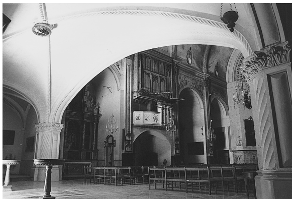
Estructura gramatical que sustenta el Cor

ció estructural i la senzillesa decorativa situaven la façana de l'església dels dominics en la tradició gòtica catalana, un fet freqüent en les esglésies conventuals de l'època. Malgrat tot, hi ha alguns elements que ens situen en un nou context artístic i litúrgic. La substitució de l'arc apuntat pel rodó en el disseny de la portada implicava la voluntat de superació de l'estètica medieval.