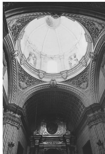
Alçat i cúpula de la Capella del Roser

gui relacionada amb la influència exercida per València; des del punt de vista espiritual, la fundació de Manacor va estar, indubtablement, sota la influència del convent valencià, que va esdevenir un dels centres més actius en la restauració espiritual posttridentina (HUGUET et alii , 1958) 26 ; des del punt de vista artístic, València havia anat exercint una important influència sobre Mallorca a partir del segle XV i havia esdevingut una fita cultural i referència obligada per al nou gust de l'art mallorquí de l'edat moderna (GAMBÚS, 1996) 27 .