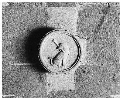
Clau que tanca una de les voltes de l'antiga cuina. S'hi perfila el relleu del ca de sant Domingo

L'art acurada i les notícies documentals ens permeten esbrinar quin va ser el valor que es va conferir al claustre en el context conventual de Manacor. La comunitat va expressar la seva profunda preocupació pels aspectes estètics, com ho demostra el constant replantejament de la configuració dels seus elements; si més