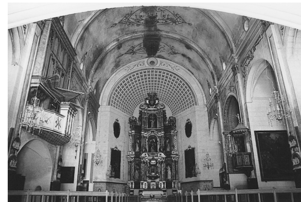
Vista de la nau de l'església conventual

L'única referència precisa és l'acte que es va realitzar el 27 de desembre de 1637 amb motiu de la benedicció de les dues darreres capelles, que foren dedicades a sant Isidre i a les Ànimes (ARM, AH-2070, info-liat 23 ). A partir del segle XVIII s'enllestiren obres de reforma i de manteniment; l'any 1730 el Consell de Pares va resol-