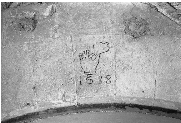
Graffiti de l'escut de Manacor acompanyat amb la data 1638. Està situat a la dovella d'un portal de la galeria nord del claustre

traslladar els tarongers a la vinya 35 .