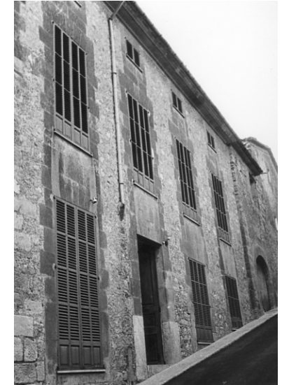
La seva casa pairal a Montuïri.