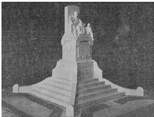
Maqueta del monument que es projectà construir en memòria del Rector.