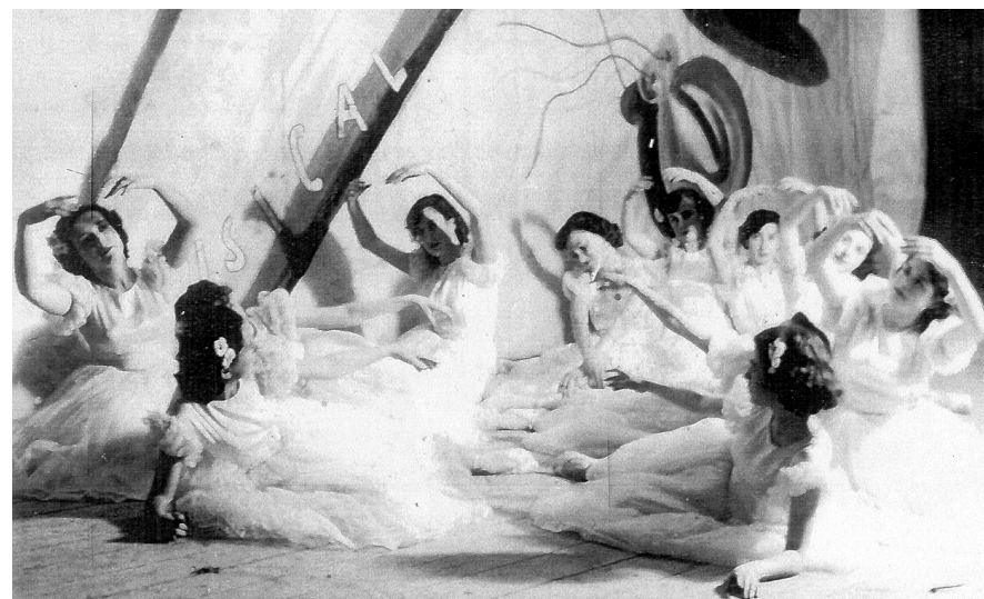
Representació dels Bosques de Viena a un d'aquests festivals.

Entre el 1950 i el 1953 se celebraren quatre grans festivals benèfics al Teatre Principal que constituïren una fita clau dins la història de la cultura a Manacor, als quals l' Arriba dedicà diversos exemplars 3 . És interessant veure com es repartien els doblers recaptats. Així, entre les dues funcions del festival de 1950 s'aconseguien 10.433'50 pessetes; després de pagar el lloguer dels altaveus (200'15 ptes.), l'orquestra (600 ptes.) i les despeses de tramoia en quedaren 8.434'80. D'aquestes, 8.000 es dedicaren a "canastillas" (el setmanari proporciona la relació de les 11 beneficiades) i 434'80 es reservaren per al proper festival.