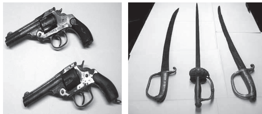
Els sabres i armes de foc que foren utilitzats com a armes reglamentàries a finals del segle XIX principis del segle XX.