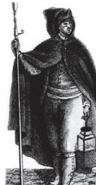
Figura representativa dels primers serenos de Manacor, anomenats popularment «cucales».

Amb el temps, tots els algutzirs passarien a denominar-se oficials