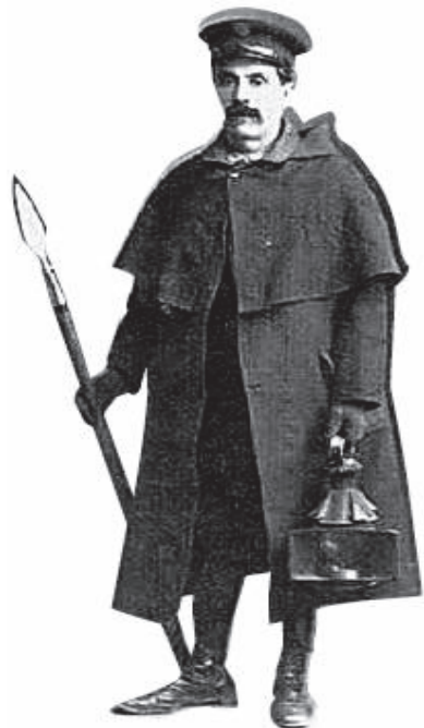
Sereno a finals del segle XIX i principis del segle XX.

Després de la revolució de 1840 que va posar fi a la regència de Maria Cristina de Borbó, mare de la futura reina Isabel II, i degut als enfrontaments entre moderats i liberals, hi hagué un gran increment de disturbis en tot el país i,