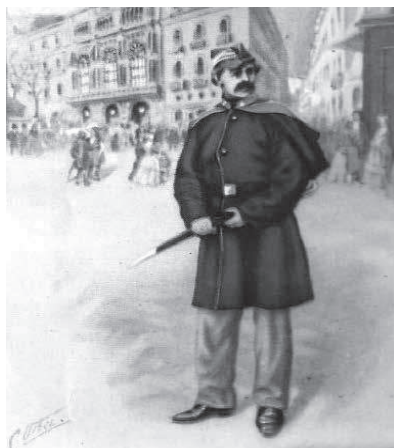
Guàrdia municipal de finals del segle XIX a Barcelona.

El sabre que solien portar com a defensa era corbat, de 70 cm de llargària des de l'extrem de l'empunyadura a la punta del sabre, i la fulla era de tres cm d'amplària. L'empunyadura era de llautó.