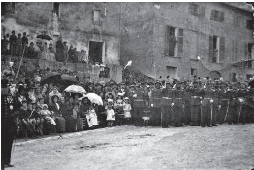
Rebuda oficial a uns militars que arribaven a Palma procedents de les guerres espanyoles a ultramar.

L'índex de mortalitat entre la tropa colonial espanyola era molt elevat; els soldats eren molt joves, la majoria eren menors de 22 anys, molts moriren pel camí amb la frescor de la joventut entre les dents.