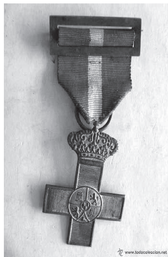
Medalla de plata al Mèrit Militar amb distintiu vermell.

Fou condecorat amb la Creu d'Argent al Mèrit Militar i una pensió vitalícia de 7,50 pessetes mensuals, segons ordre publicada en el Diari de Guerra 144-198, i una pensió per als seus pares. Estava destinat a la II companyia d'Infanteria, com a soldat 2a.