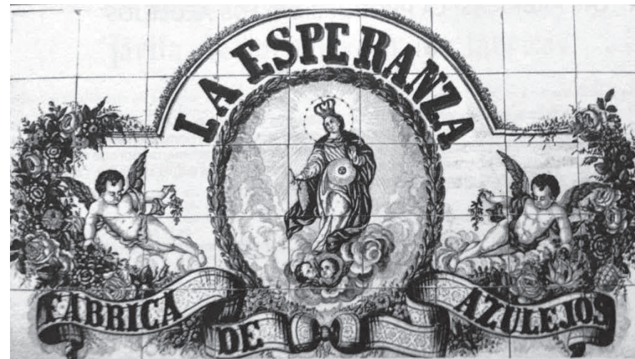
Panell ceràmic de la fàbrica La Esperanza, d'on procedeix el conjunt del Museu d'Història de Manacor.

També cal destacar un panell ceràmic propagandístic amb la inscripció «La Esperanza, fabrica de azulejos», en què es pot observar la cinta desplegada a la part inferior.