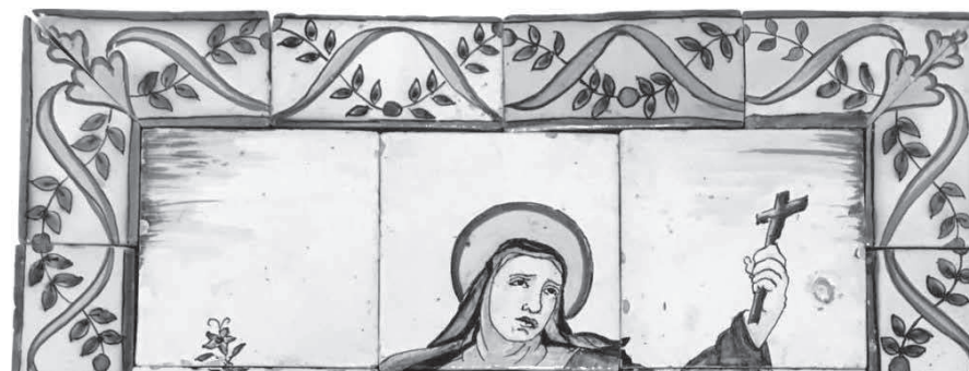
Detall del panell ceràmic dedicat a la beata Serafina Sforza (Museu de Menorca).

per rajoles de mitja sanefa on apareix la cinta. Els colors emprats són groc, verd, negre i taronja. Es tracta d'un model molt similar al de la col·lecció Marroig procedent d'una casa del carrer de l'Almudaina, però aquí la funcionalitat és diferent, ja que la trobem en un context religiós.