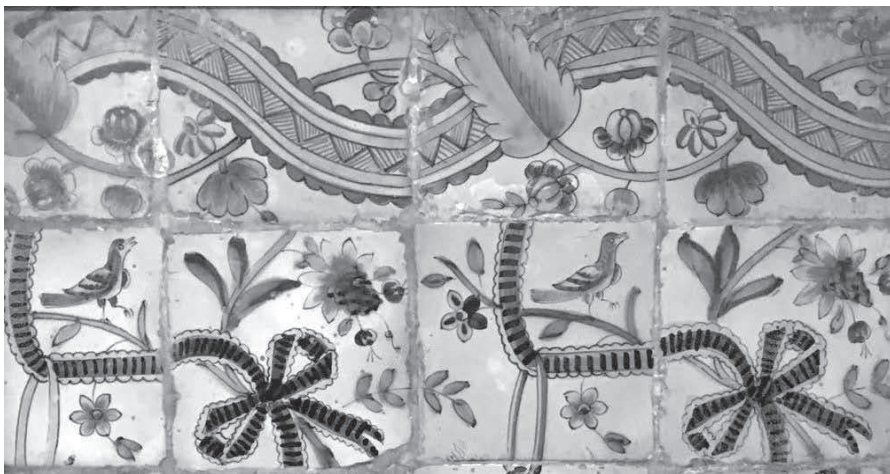
Detall del panell ceràmic de la capella de les Ànimes de la catedral de Menorca.

Aquest cop no se'ns presentarà la cinta emmarcant cap escena hagiogràfica sinó que trobarem una barreja d'elements tèxtils (la cinta formarà llaços, a més de sostenir petites cistelles), vegetals i zoomorfs.