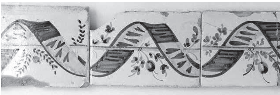
Conjunt conservat al Museu d'Història de Manacor.

En primer terme cal destacar els sis exemplars conservats al Museu d'Història de Manacor, ja que són el punt de partida d'aquesta investigació.