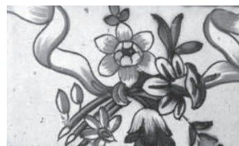
Motiu d'un dels exemplars de l'antic convent de la Trinitat de Xàtiva.

Quant als elements ornamentals, és necessari distingir dos registres. En primer terme trobem un tipus de rajola que presenta un ramell florit de forma aïllada. Curiosament aquest motiu en altres composicions anirà superposat a la cinta volandera, tal com es pot observar a la mostra ja esmentada procedent del convent trinitari de Xàtiva, actualment al Museu de l'Almodí.