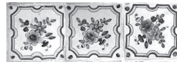
Rajoles amb ramells del convent de Manacor.

Finalment, trobem la cinta volandera a manera de marc ornamental, com és habitual. Es tracta d'una de les mostres més complexes localitzades a Mallorca, fet que fa pensar en una cronologia avançada, probablement de mitjan segle XIX. La cinta tèxtil presenta una decoració policroma amb ziga-zagues.