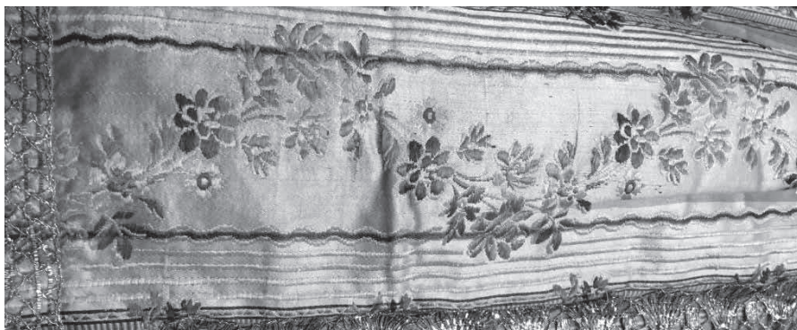
Garlanda d'un dels draps de puresa del Sant Crist de Manacor.

A l'àmbit dels teixits també hi ha algunes correspondències, en el cas de Manacor destaca una cinta vegetal en un dels draps de puresa del Sant Crist.