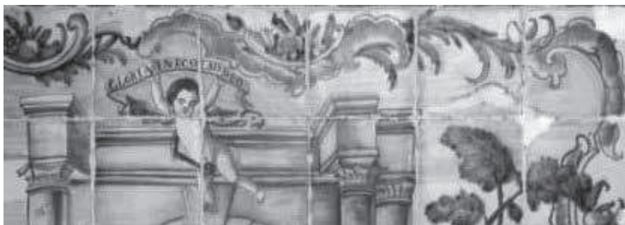
Detall d'un dels panells ceràmics del santuari de Nostra Senyora de Gràcia.

La popularitat de la cinta volandera serà tan notable a les illes que transposarà les fronteres de la ceràmica i arribarà a la resta de les arts decoratives del segle XVIII i XIX. En la publicació Ventalls (2009), trobem alguns ventalls confeccionats durant el transcurs del segle XIX on se'ns presenta una cinta desplegada en el centre de la seva composició, combinada amb elements vegetals, igual que el que succeeix amb la rajola de mostra.