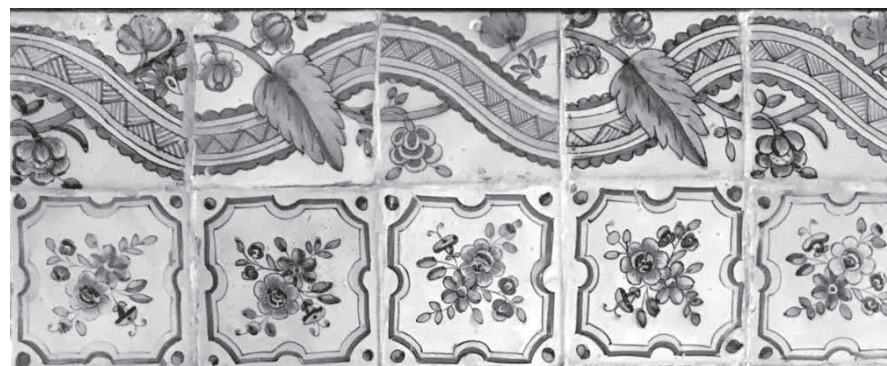
Detall de l'absis del convent de Sant Vicenç Ferrer.

Finalment, trobem la cinta volandera a manera de marc ornamental, com és habitual. Es tracta d'una de les mostres més complexes localitzades a Mallorca, fet que fa pensar en una cronologia avançada, probablement de mitjan segle XIX. La cinta tèxtil presenta una decoració policroma amb ziga-zagues.