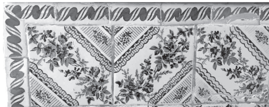
Conjunt de l'església parroquial de Felanitx.

A Menorca també es localitzen alguns casos: al convent de San Francesc de Maó (actual Museu de Menorca) hi ha un conjunt de panells votius dedicats principalment al sant franciscà; no obstant, també es representen escenes de la Passió de Crist. Aquestes composicions es troben inserides en un marc format