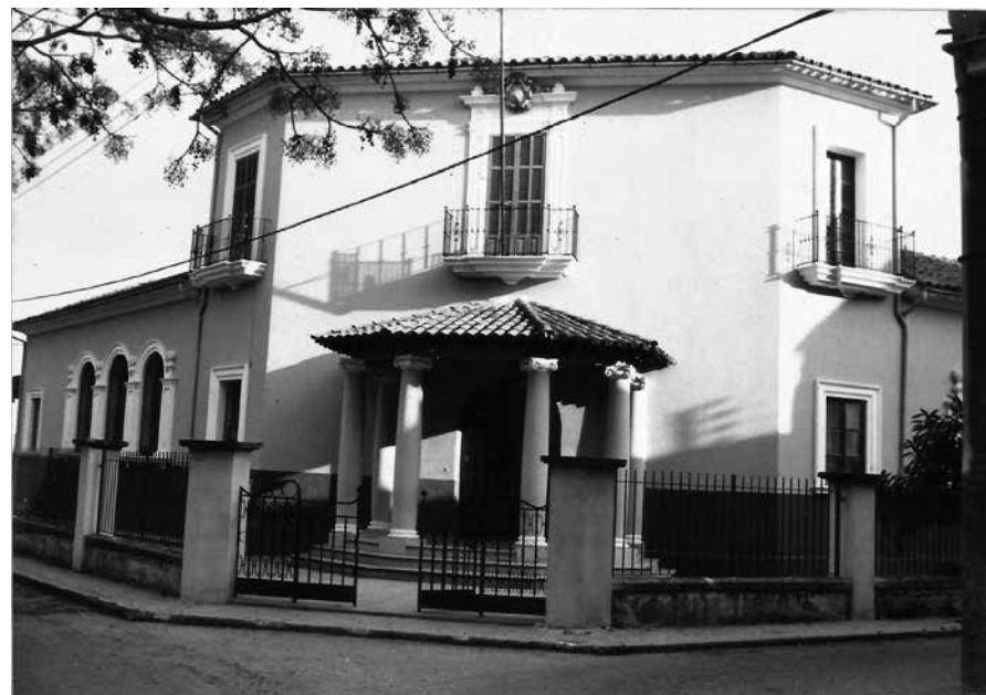
Escola Graduada, inaugurada el 14 d'abril de 1932.