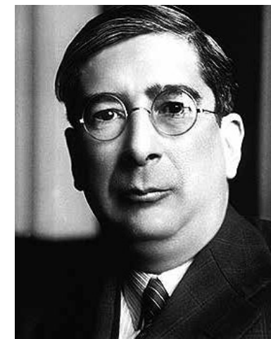
El ministre d'Instrucció Pública, Marcel·lí Domingo i Sanjuan (1884-1939), peça clau per a l'obtenció de la subvenció per acabar l'Escola i la creació de quatre escoles unitàries el 1936.