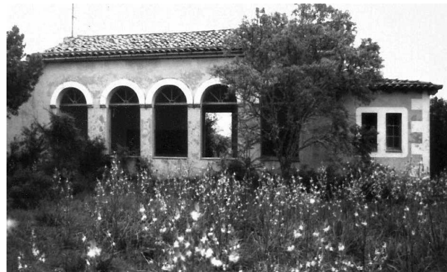
Escola de sa Murtera; les obres s'acabaren a finals de 1931. Fa uns anys es va rehabilitar.