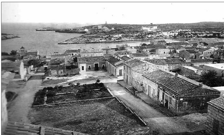
Als jardins de davant l'església de Porto Cristo es trobaren, pocs dies després, 14 granades de mà, marca Lafitte.