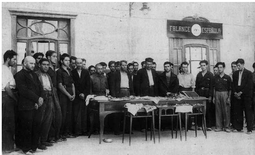
Els 39 «rojos» que varen ser exposats i fotografiats a sa Bassa abans de ser executats a Son Coletes.

més de quinze dies d'aquella retirada forçada per Madrid que va ser convertida en victòria pel comandament nacional, atribuïda a la perícia del tinent coronel García Ruiz i, infantilment, als miracles del Sant Crist de Manacor. No, no s'havia acabat l'escorcoll obsessiu de cases, cisternes, pous, soterranis i barraques de roters cercant l'enemic: tota aquella persona que havia simpatitzat amb la República, s'havia mostrat partidària d'erradicar l'analfabetisme, favorable a un sistema contributiu més just, o que fos atea, poc creient o a qui, d'altra banda, se li degués diners o disposàs de bens materials o personals —la dona, per exemple— desitjats pels que tenien poder sobre la vida i la mort.