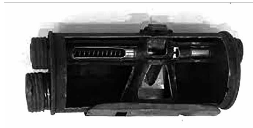
La granada de mà Lafitte, que es fabricava a zona nacional.

A la mateixa pàgina 3, a la secció de necrològiques apareixien també els