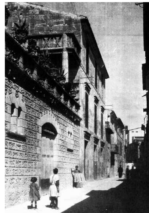
L'antic hospital, convertit anys després en el Cine Goya, a l'actual carrer P. Andreu Fernández.