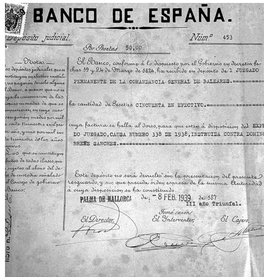
Resguard del dipòsit de 50 pessetes al Banco de España per la venda en subhasta del rellotge d'or (AJTT33 causa 338/38, peça separada de subhasta i remat f. 4).