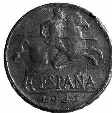
15. Anvers de la moneda de 10 cèntims dels primers anys del franquisme (5835 – MHM).

Un cop acabada la guerra, les monedes republicanes encara circulaven per Espanya. Les monedes sempre tenen un valor simbòlic i propagandístic; per tant, era necessari treure-les de la circulació el més ràpid possible. Així doncs, entre 1939 i 1940 es varen anar retirant totes les monedes de la República i es començaren a encunyar les primeres monedes del règim, de 10 i 5 cèntims. A causa de la mala situació de l'època, eren monedes fetes amb alumini, un altre metall precari. La primera moneda d'aquesta època del fons data de 1941 i té un valor monetari de 10 cèntims. A l'anvers, el tipus mostra la representació d'un guerrer iber, fet per Carlos Mingo, seguint el model de les monedes hispano-romanes d'Osca 11 (fotografia 15), i al revers hi havia l'escut del règim (fotografia 16).