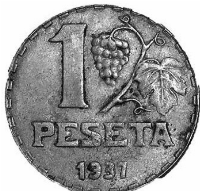
14. Revers de La Rubia, moneda republicana d'una pesseta (5440 – MHM).

l'època, cosa que es pot veure en les imperfeccions de la peça. A més, el llautó li ofería un aspecte groguenc, que juntament amb la representació al·legòrica de la República com a tipus, li valgué el malnom de La Rubia . 10 Quant a la iconografia, a l'anvers, hi ha la representació com a tipus d'un bust femení cap a l'esquerra com a al·legoria de la República (fotografia 13). El tipus del revers està format per una branca de pàmpol i un carràs de raïm, més el valor monetari i l'any d'encunyació (fotografia 14).