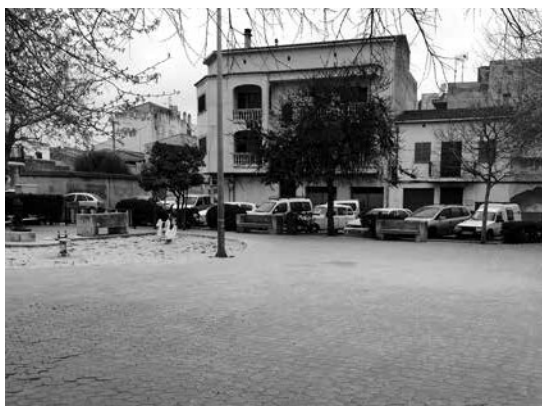
La plaça del Cardenal Pou, on abans hi havia la pista on competien els karts, en l'actualitat.