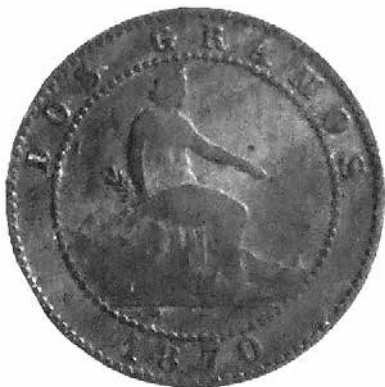
9. Anvers d'una moneda de 2 cèntims del Govern Provisional (5917- MHM).

Pel que fa a la col·lecció, és l'època amb més monedes custodiades al Museu: 71 monedes, totes encunyades l'any 1870. Són monedes de coure, un material molt precari, cosa que es pot veure en el mal estat de conservació de pràcticament totes les monedes. Les primeres monedes que es produïren foren les de cèntim (1, 2, 5 i 10 cèntims). Iconogràficament, eren idèntiques, simplement en variava la mida. A l'anvers (fotografia 9), el tipus representa una al·legoria de la llibertat asseguda a un tron, rodejada per una gràfila de punts. Al revers (fotografia 10), com a tipus, hi trobem el lleó d'Hèrcules sostenint l'escut amb les armes de Castella, Barcelona, Navarra, Lleó i Granada.