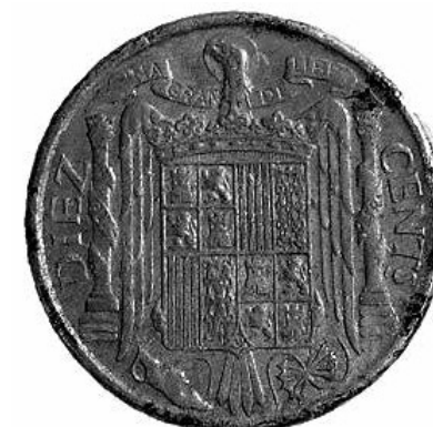
16. Revers de la moneda de 10 cèntims dels primers anys del franquisme (5835 – MHM).