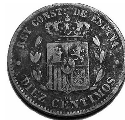
12. Revers d'una moneda de 10 cèntims d'Alfons XII (5411 - MHM).