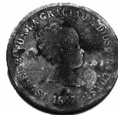
6. Moneda falsa d'època (5383 – MHM).

Pel que fa a les segones, són monedes que s'encunyaven en honor a algun esdeveniment important i no tenien cap mena de valor nominal. En la col·lecció, en destaca una que commemora l'arribada de les aigües de Lozoya a la capital l'any 1858. A l'anvers (fotografia 7), en el tipus, hi ha la representació de la reina Isabel II i el rei consort Francesc d'Assís. Al revers (fotografia 8) hi ha una