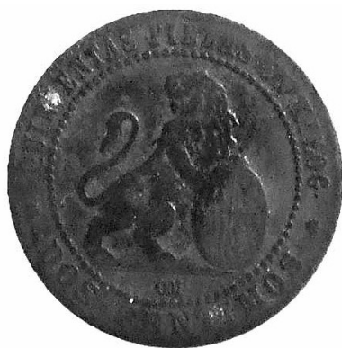
10. Revers d'una moneda de 2 cèntims del Govern Provisional (5917- MHM).