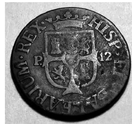
2. 12 diners de Palma de 1812 (5432 – MHM).