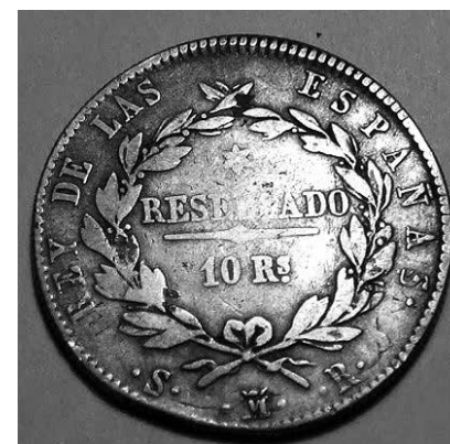
3. 10 reals ressegellats de 1821 (5429 – MHM).

vis de govern, etc. Tot això es reflectia en el sistema monetari. Com a exemple, aquesta moneda de 10 reals d'origen francès ressegellada (fotografia 3), és a dir, s'encunyava moneda espanyola sobre moneda francesa.