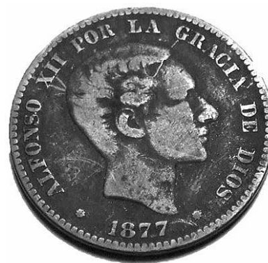
11. Anvers d'una moneda de 10 cèntims d'Alfons XII (5411 - MHM).