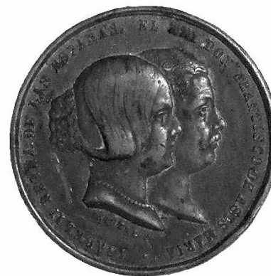
7. Anvers de la moneda commemorativa de les aigües de Lozoya (5974 – MHM).