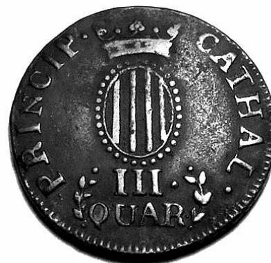
1. 3 quartos catalans de 1811 (5431 – MHM).