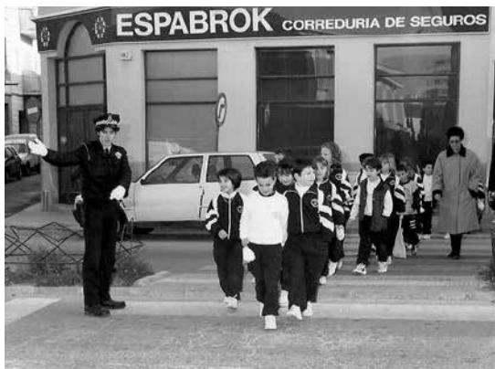
La Policia Local de Manacor ensenyant als escolars a creuar la calçada per un pas de vianants.

L'any 2013, amb la creació de la figura del policia tutor, aquests es feren càrrec de les competències en matèria d'educació viària, que abans depenien del departament de Trànsit de la Policia Local.