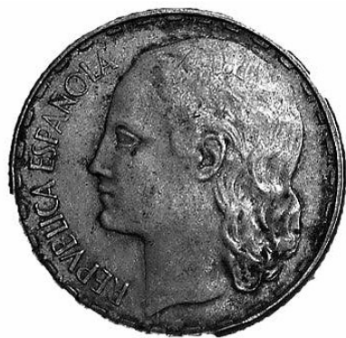
13. Anvers de La Rubia, moneda republicana d'una pesseta (5440 – MHM).

Davant la necessitat de moneda fraccionària, Juan Negrín, ministre d'Hisenda, va promoure la creació de monedes d'1 i 2 pessetes. Al final, només s'emeté la primera a un taller de Castelló. En el MHM es conserva una moneda d'1 pesseta, feta de llautó, material precari producte de les necessitats de