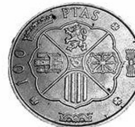
21. Revers de 6 monedes de 1966 en valor de 50 cèntims, 1, 5, 25, 50 i 100 pessetes (MHM - 5847, 5857, 5875, 5823, 5822, 5455).