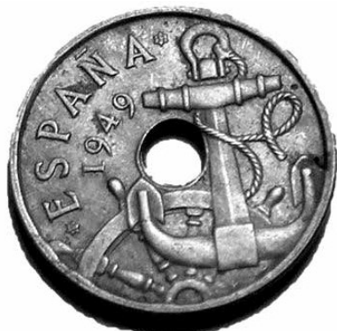
17. Anvers de la moneda d'1 pesseta dels primers anys del franquisme (5867 - MHM).