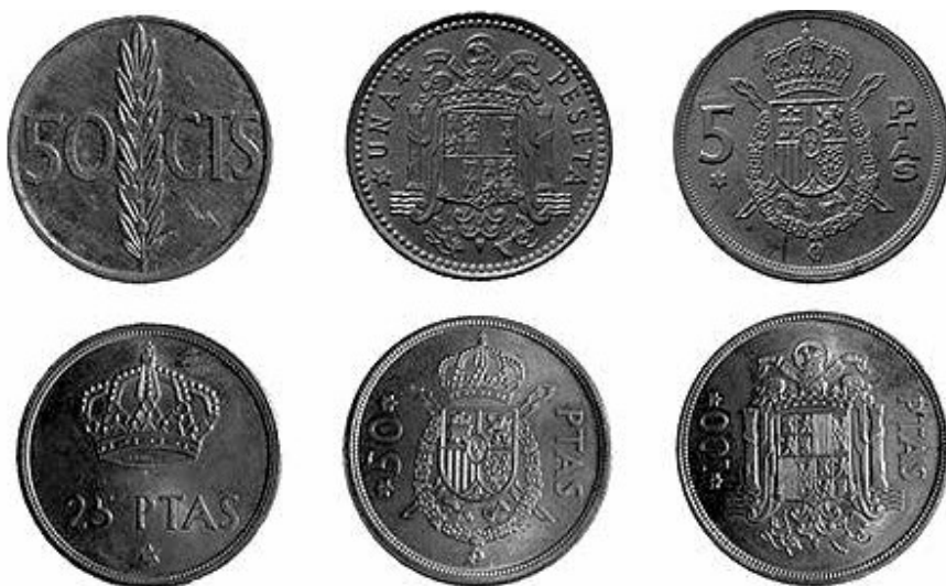
22. Revers de 6 monedes de 1975 en valor de 50 cèntims, 1, 5, 25, 50 i 100 pessetes (MHM – 5849, 5858, 5829, 2824, 2834).

als 19 grams. Pel que fa als materials, anava millorant la seva qualitat amb major valor nominal: des de l'alumini fins a la plata. A la taula següent es pot observar la relació de mesures, pesos i materials. És una estandardització que continuarà després de la mort del dictador.