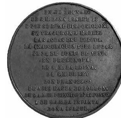
8. Revers de la moneda commemorativa de les aigües de Lozoya (5974 – MHM).