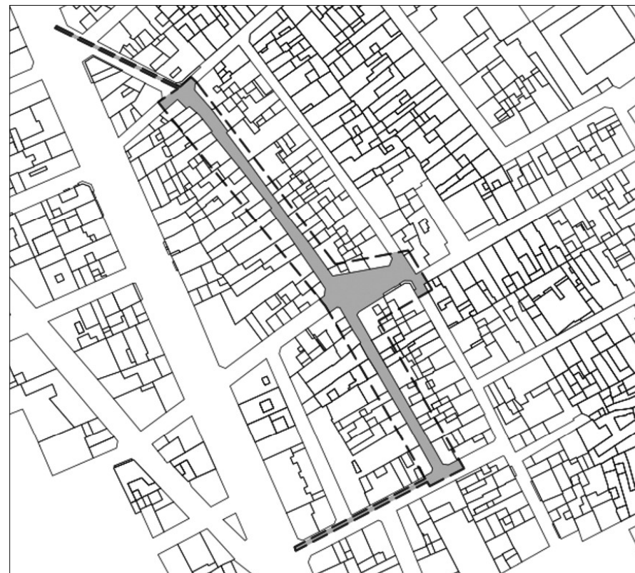
Delimitació de la zona d'afecció de les obres.

El projecte arquitectònic començava al carrer dels Gerrers; tot i així, per tal de dur a terme les connexions dels diferents subministraments va ser necessari començar les síquies en el carrer dels Montcades. Tot i que aquest tram inicial