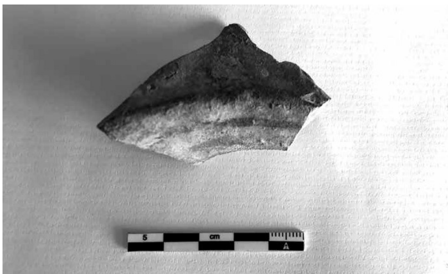
Fragment d'escudella del taller d'Inca del segle XVII–XVIII recuperat al carrer dels Gerrers, 1–3.