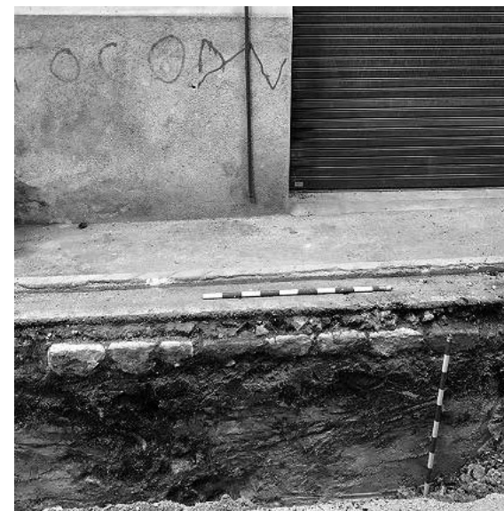
Detall de la voravia apareguda al primer tram del carrer dels Gerrers.

nivell d'asfalt i la seva preparació amb material de compactació de devers 10 cm; seguidament una UE de terra marró obscur amb pedra petita i mitjana, on apareixen alguns fragments de ceràmica comuna, la potència de l'estrat varia entre 80 cm a l'inici del carrer fins a reduir-se a 15 cm a l'altura del carrer dels Gerrers, 12; finalment, apareix el terreny natural amb un sediment argilós de color gris. A partir del carrer dels Gerrers 12, l'estratigrafia canvia i puja la cota de terreny natural, en aquesta ocasió petri, just davall de l'asfalt i la seva preparació.