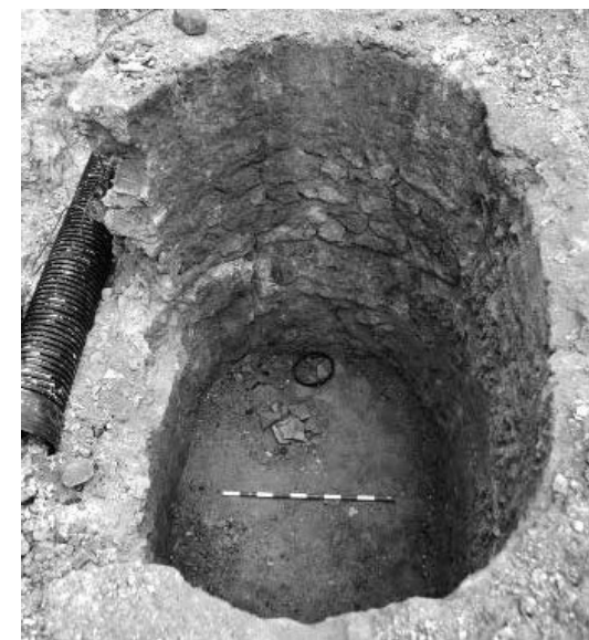
UE 9 del pou, en el qual es pot veure una concentració de rajola hidràulica totalment fragmentada a la part superior.

estrat és manté homogeni amb un sediment argilós i pedra mitjana, molt similar al terreny natural que es troba a les proximitats; possiblement es tracta de les restes d'alguna reforma al subsol de la zona. La UE 9 és una barreja de sediments de diferents colors i abundant material modern (figura 6); a pesar de la diferència de colors entenem que es tracta d'una mateixa acció, la de reomplir el pou i amb ceràmica comuna contemporània. Alguns dels veïnats recordaven que quan eren petits se'ls havia demanat que aboquessin al pou tot