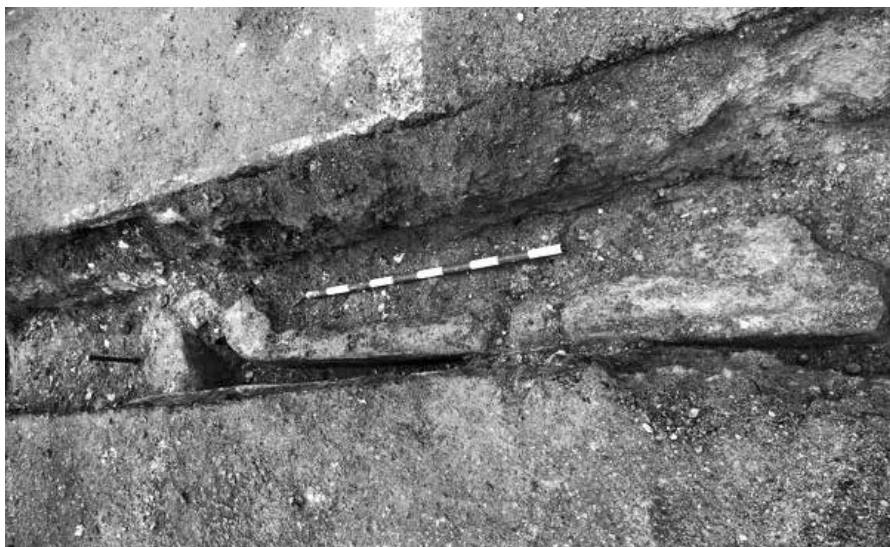
Detall d'una de les canalitzacions documentades al carrer dels Montcades, 1.

A l'altura del carrer dels Montcades, núm. 1, aparegueren les antigues canalitzacions, de marès i amiant, del carrer (figura 2). L'edifici, segons la Seu Oficial del Cadastre, fou construït en 1950, fet pel qual ens podríem trobar amb les canalitzacions originals de l'edifici. En aquest cas, degut a disposar del marge suficient, es va pujar l'altura de la canonada i així se n'evità l'afecció per les obres. Tot i així, es va decidir excavar i documentar-les abans de tornar-les a tapar amb graves petites que en permetessin la conservació.