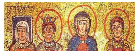
Figura 4. Basilica romana de Pudència i Pràxedes. Episkopa Theodora (la primera de l'esquerra). S. IX EC

sembla que la suposició que mai no hi va haver dones amb oficis eclesiàstics és falsa. A Orient són més habituals les inscripcions de dones diakons fins ben entrat el segle VI. A Occident també trobam algunes inscripcions, però menys (fig. 5a). En canvi, els testimonis de dones preveres (fig. 5b) són més comuns a Occident que a Orient, un factor vertaderament intrigant. 38 Curiosament, el que tenim més a Occident són les prohibicions conciliars promulgades per controlar o suprimir la pràctica