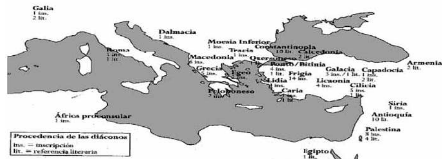
Figura 5.a. Fotografia de la procedència de dones diaconesses.