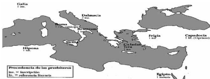
Figura 5.b. Fotografia de la procedència de dones "preveres".

existent del diaconat i del presbiterat (sacerdoci).