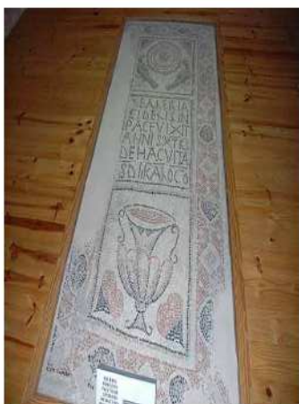
Figura 1.

La lauda sepulcral de Balèria (fig. 1) es trobava als peus de la nau de l'evangeli, paviment musiu organitzat en cinc panells musivaris. La lauda conté un epitafi al·lusiú a la difunta. Encara que aparegui escrit Balèria , amb B i amb una lambda ( \lambda ) grega, el nom real segurament fou Valèria. 15 A Àfrica en trobam paral·lelismes: 16 alguna làpida amb el mateix nom de Balèria i d'altres amb el nom de Valèria (fig. 2).