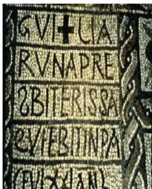
Figura 2. Basilica de Seti. Segons N. Duval.

En el quadre central trobam l'epitafi següent: " Balèria fidel, va viure en pau seixanta anys. Va passar d'aquesta vida el dia II de les calendes d'octubre". La inscripció va precedida per un motiu vegetal de color vermell, que s'ha interpretat com una palma. Si establim paral·lelismes, la inscripció segueix les formes usuals: el nom de la difunta, acompanyat de l'expressió fidelis in pace , i de l'edat, vixit