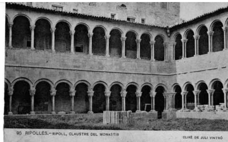
Postal del claustre de Ripoll.

Quant als edificis romànics, Alcover, per estudiar-los en profunditat, a més d'observar-los i plasmar en el dietari les seves descripcions i les impressions que aquests li causaven, en prenia mides i en dibuixava tots aquells perfils i parts necessàries per poder-los conèixer bé. També és destacable el fet que a la Institució Pública Antoni M. Alcover hi ha una col·lecció de postals que eren propietat del canonge i que representen fotografies de molts dels edificis romànics visitats durant l'eixida del 1900. És molt probable que el mateix Alcover adquirís aquestes postals durant el viatge o que, posteriorment, els companys que l'havien acompanyat les hi enviassin.