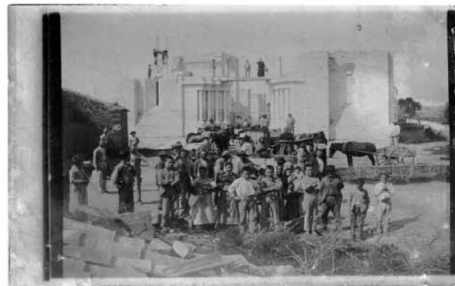
Construcció de l'església de Son Carrió

La primera pedra de l'església es va posar dia 22 de maig de 1899 i la inauguració va ser dia 14 d'abril de 1907.