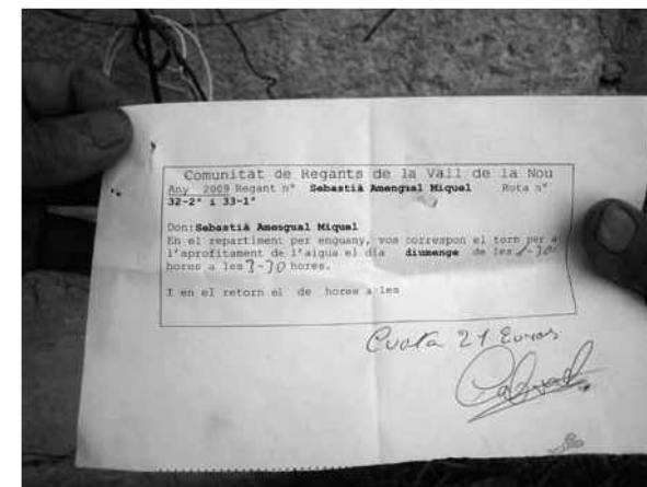
Acreditació de l'any 2009.

Sa Vall, de totes maneres, ha vist i veu també tarongers, albercoquers, ametlers, caquiers, cirrers, figueres, magraners, melicotoners, nespleres, noguers, pereres i pruneres. Poca gent ja recorda que el 1944 i anys