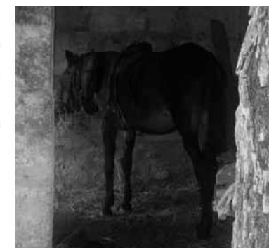
En Menut descansant

- Qui m'ho hagués dit, a mi, que em costaria tant pujar al carro d'aquesta manera...!»