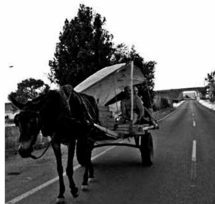
Pel camí de Bendris

Quina és l'aportació dels Lliro avui dia? Encara mantenen un sistema de vida ancestral que conviu amb