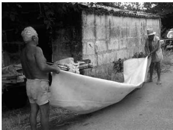
Desplegant la vela.

Els germans Lliro saben bé qui enganxa encara i qui no, i recorden “un jove de per devora sa Canova, encara enganxa... Però el carro no és com el nostre, va amb un carro bo, amb bandes i rodes de ferro...”.