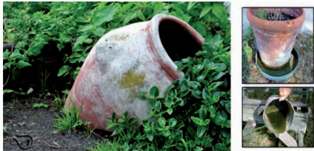
Possibles focus de moscards