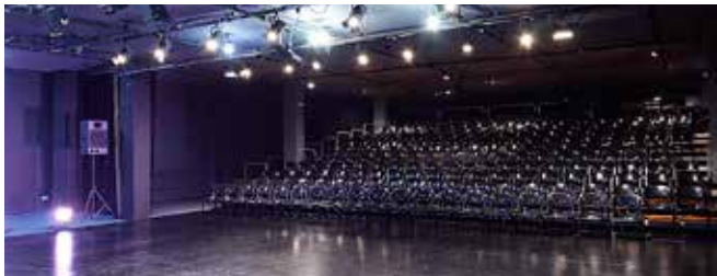
Teatre de Manacor Sala de Dalt 240 espectadors