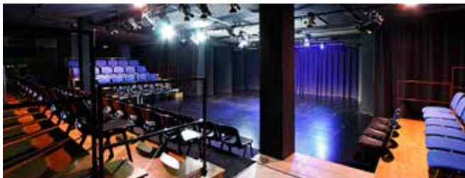
Teatre de Manacor Sala de Baix 137 espectadors

Temporada 2017/2018: 95.509 espectadors i usuaris