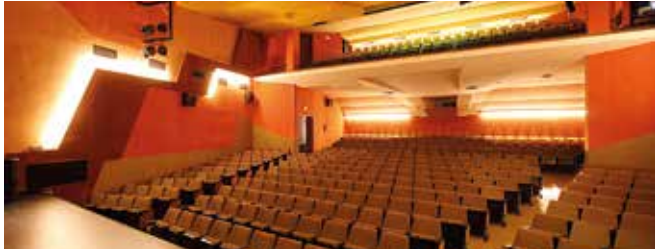
Teatre de Manacor Sala Major 453 espectadors