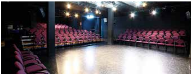
Teatre de Manacor Sala d'Enmig 170 espectadors