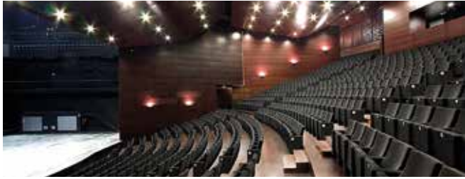
Auditori de Manacor 800 espectadors