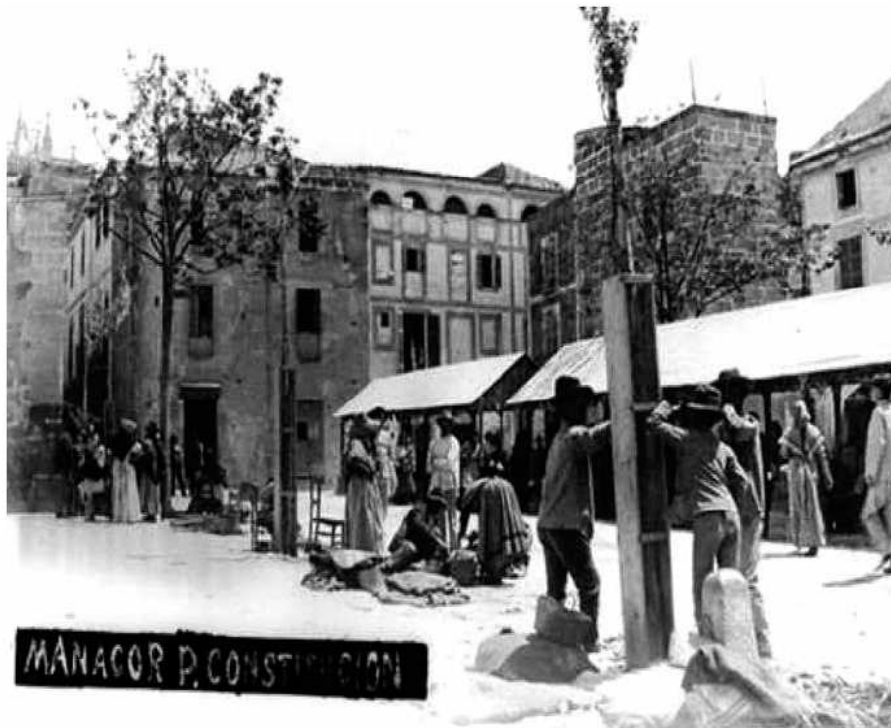
Plaça de la Vila.