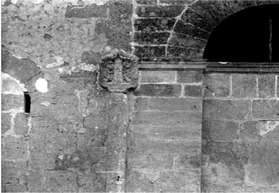
Creu adossada a la façana de l'antic escorxador.