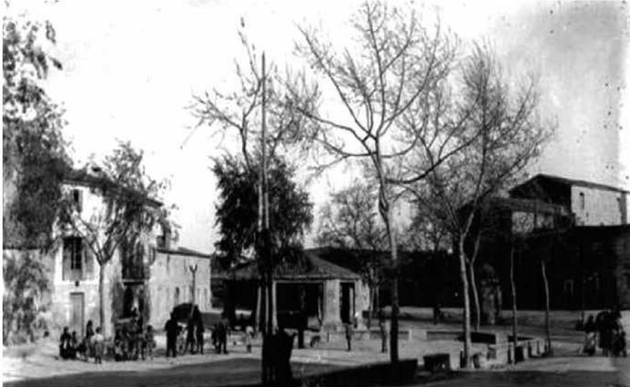
L'antic Pla dels pous, actual plaça del Mercat.