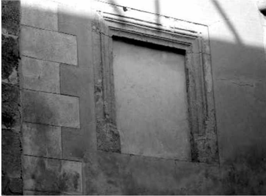
Finestra del carrer del Príncep.