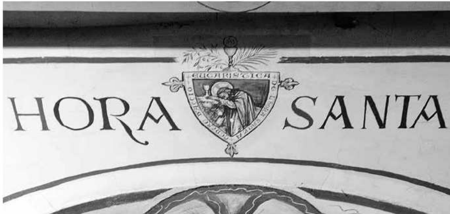
Escut i inscripció de l'Hora Santa a la capella del Sagrari a Crist Rei.